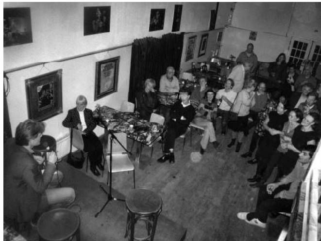
Afscheidsbijeenkomst van het MAPP. Hier werden alle (vrijwillige) medewerkers hartelijk bedankt voor al hun grote inzet. (10-12-2010)

Het MAPP concentreerde zich tot december op het overdragen van zoveel mogelijk kennis aan anderen, met in het bijzonder een focus op de advocatuur die een belangrijke rol blijft spelen in het signaleren van psychische problemen bij hun cliënten. Op 10 december organiseerde het MAPP een bijeenkomst ter afronding van het project. Ook zijn we bezig met een eindpublicatie waarin wij nog een keer aandacht zullen vragen voor de door ons gesignaleerde verbeterpunten.