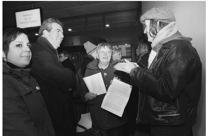
Aanbieding van een eerdere petitie aan de Tweede-Kamercommissie voor Justitie. (26-1-2010)