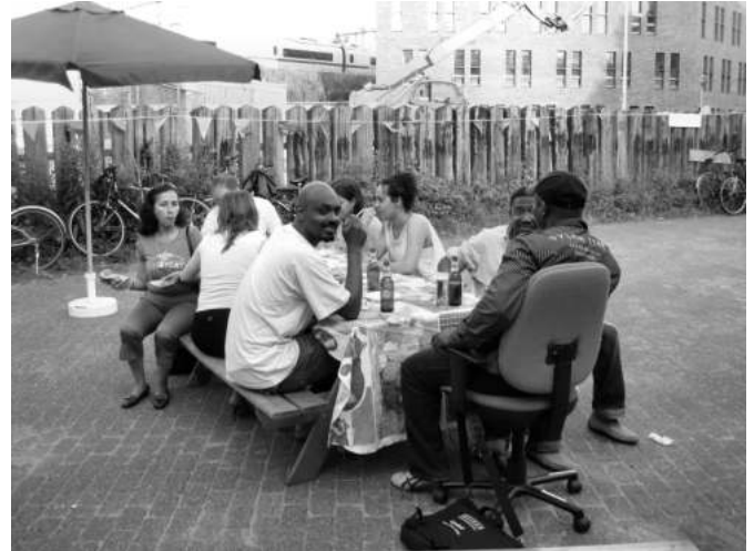
Na het uitdelen van de diploma's Nederlands is er een feestelijke bijeenkomst.

Primair is de cursus bedoeld voor de diënten van het ASKV en de Steungroep Vrouwen Zonder Verblijfsvergunning. Als er plaatsen over zijn, kunnen andere 'ongedocumenteerden' zich ook inschrijven. Met als gevolg dat er mensen uit de Oekraïne, Afrika, Nieuw-Zeeland, China of Zuid-Amerika zich over dezelfde grammatica-oefeningen buigen: ik ben, jij bent, hij is, etc. Er wordt veel aandacht besteed aan conversatie. Bij de beginners beperkt zich dat vaak tot familieverhoudingen: 'Hoeveel broers heb jij? Heb je ook zussen?' of voedsel: 'Eten ze in China ook gehaktballen?' Bij de gevorderden zijn de onderwerpen serieuzer. Onderwerpen als cultuurverschillen in Nederland, tussen de culturen van de cursisten onderling, jongeren en drugs of problemen die de hele wereld aangaan zoals de opwarming van de aarde. De taal leren kan dan wel het primaire doel van deze cursus zijn, er is veel aandacht voor de sociale component. Wij proberen om in het vaak ongewisse en onregelmatige bestaan van de cursisten een stabiele factor te zijn. Zij geven zelf ook aan dat het volgen van de lessen, vooral als zij niet mogen werken, een welkome afwisseling is en structuur geeft aan hun week. Onze aanpak is erop gericht om hen een status te geven, die van 'cursist'. Zij schrijven zich officieel in, krijgen boeken, er worden presentielijsten bijgehouden. Hoewel er alle begrip is voor alle andere zaken in hun leven die aandacht