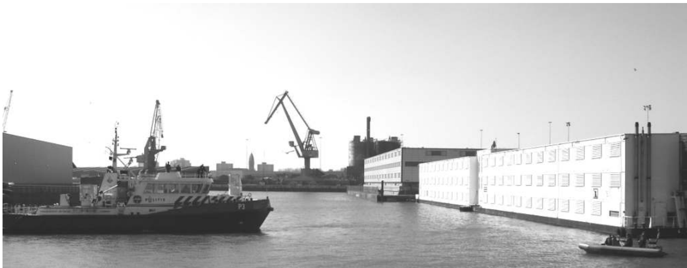
Detentieboot in Rotterdam